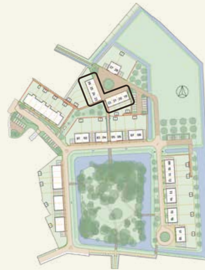
SCHUURWONINGEN - BOUWNUMMERS 19 T/M 26